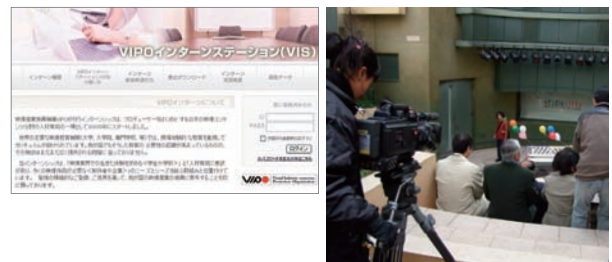
学生にコンテンツの制作現場を体験してもらうことを目的に、VIPOが仲介し、コンテンツ企業に学生を紹介。