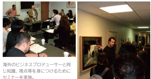
海外のビジネスプロデューサーと同じ知識、視点等を身につけるためにセミナーを実施。