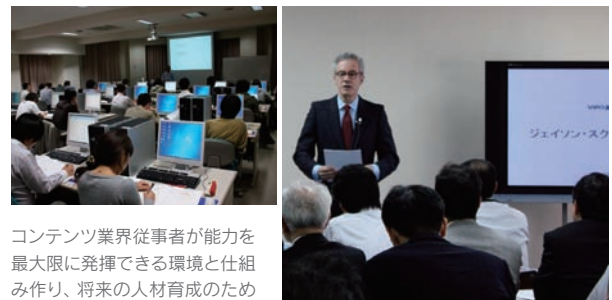
コンテンツ業界従事者が能力を最大限に発揮できる環境と仕組み作り、将来の人材育成のために各種セミナーを実施。