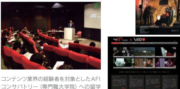
コンテンツ業界の経験者を対象としたAFI コンサバトリー（専門職大学院）への留学斡旋の事業を実施。