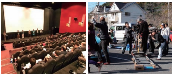
若手映画作家の発掘と育成を目指したワークショップ、35mmフィルムでの撮影による製作実地研修。