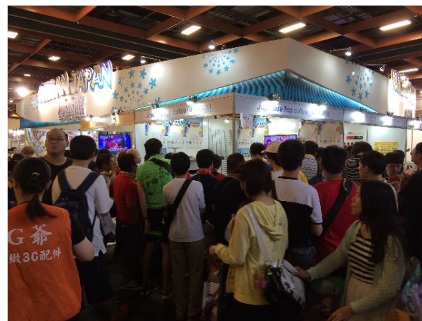
▲ブース周りの行列