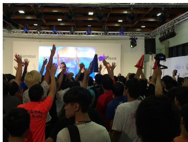
▲虹のコンキスタドール