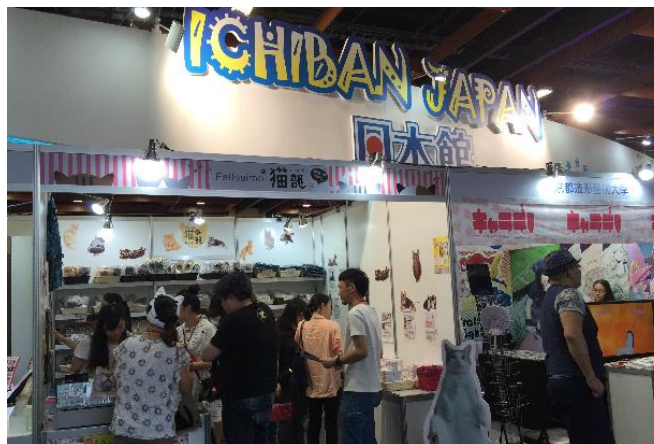
▲フェリシモ猫部様ブース