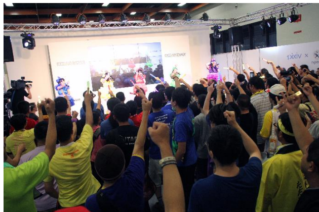
▲チームしゃちほこ