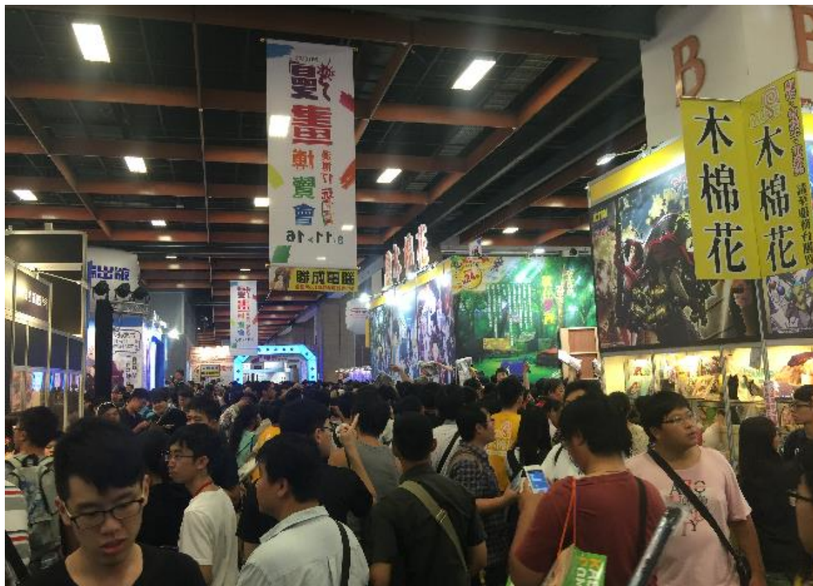
▲会場内様子 例年、歩行が困難なほど多くの来場者となる。