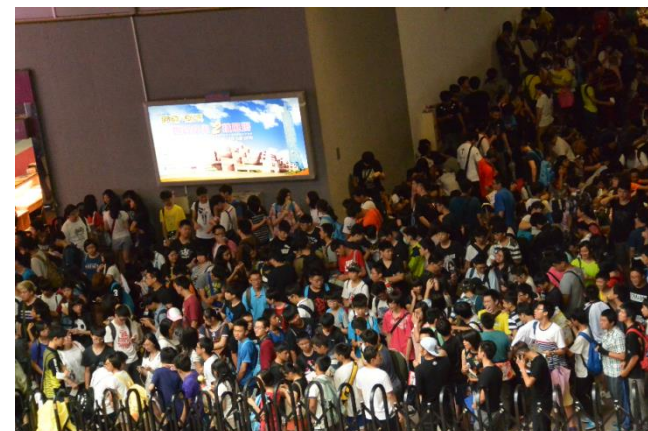
▲開場前 ▼入場制限のブースに駆け入る方々