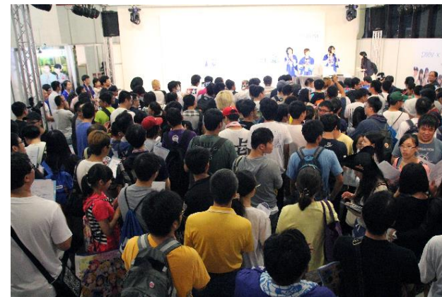
▲アニメイト×西武線