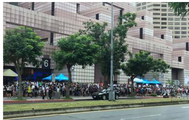
▲2日前から待機するファンも多く、期待が伺えました