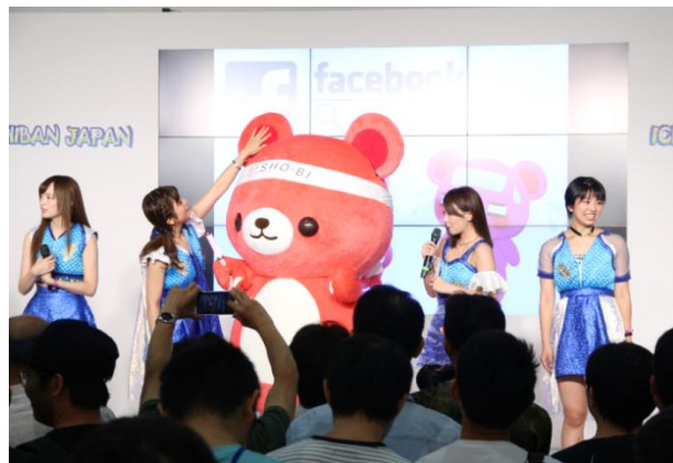
▲SHO-BI Yell君 × ユイガドクソン