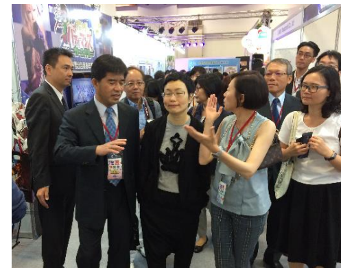
▲文化部 丁政務次長による視察