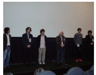
●合評上映会・講評会