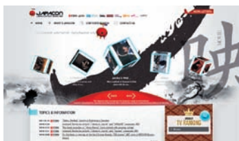
コンテンツ・ポータルサイト 「ジャパン・コンテンツ・ショーケース」 http://www.japancontent.jp/

VIPOは、本運営協議会より受託し、運営事務局を担当している。本サイトは、日本のコンテンツ情報を国内外に発信するWEBサイトとして2007年6月に開設された。2011年3月には、DB中心のサイトから海外に向け英語で日本コンテンツ情報を発信するサイトに刷新し、海外のコンテンツ関連事業者には、毎月メールマガジンの配信も実施した。