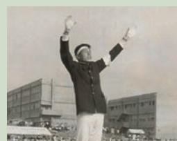
高校の運動会で応援団長を務めた時