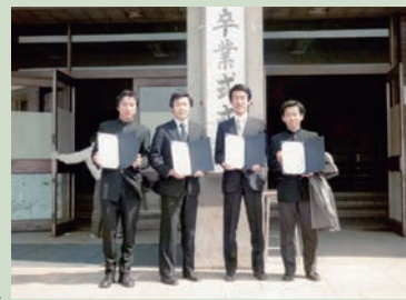
慶應義塾大学の卒業式にて友人と

30代に手塚治虫氏とロサンゼルスでの講演会に出張した際。