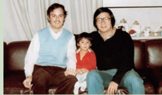
1982年にアメリカ留学時の友人と