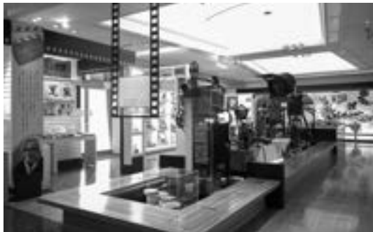
葛飾柴又寅さん記念館・山田洋次ミュージアム